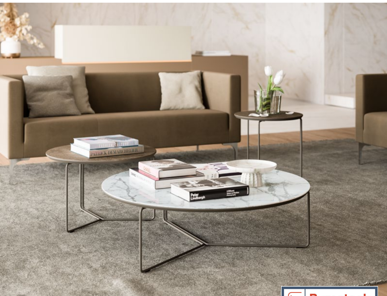
Table basse design luxe