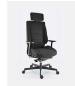
AC77/11 B ECO